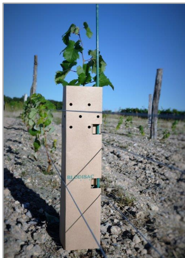
Plant de vigne (Coteaux du Vendômois)